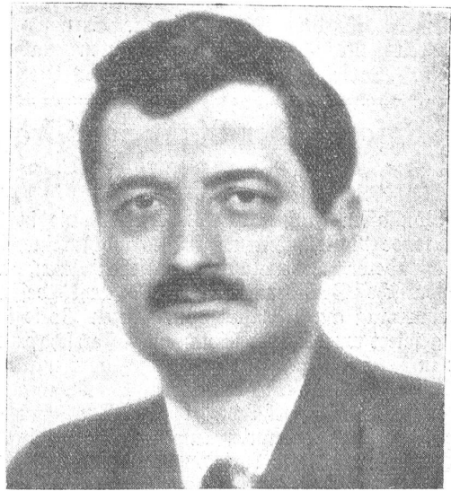
Prof. Hermann Oberth, der Konstruktor der Weltraumrakete. Er plant zunächst den Abschluß einer Rakete ohne Menschen bis 40 Kilometer Höhe.

ist, die Rakete so zu bauen, daß der Brennstoff in beschleunigtem Tempo verbrennt, so glaubt man auch, in höheren Regionen allmählich die nötige „kosmische“ Geschwindigkeit