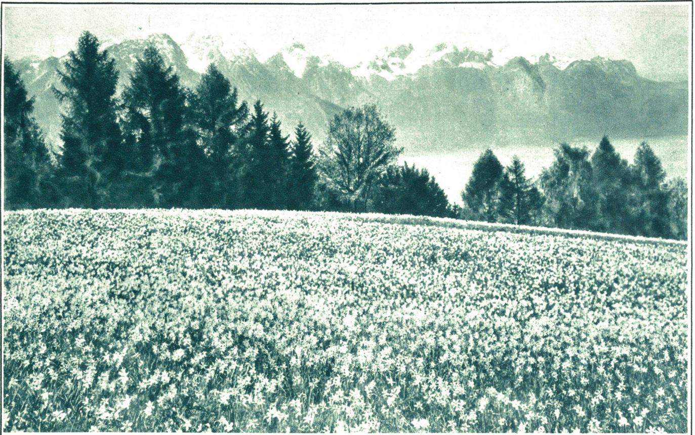
Narzissen bei Montreux mit Blick auf die Savoyer Alpen und den Genfersee, das Frühlingsziel Tausender.