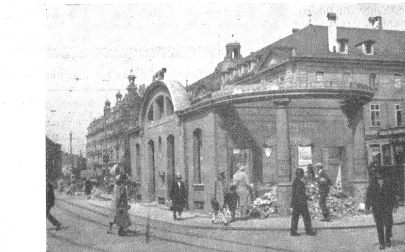
Der Abbruch des Tramhauses auf dem Bubenbergplatz.

Aber ganz genau genommen ist Bern auch heute noch keine so entsehlliche Steinvüste, daß man, wie z. B. in New York, alle paar Tage hinaus müßte, um nicht zu verstauben. Es gibt auch außer der Innern Enge noch ganz nette „Grüninseln“ als da sind Kasinogarten, Münsterplattform, Rosengarten u. Und sie sind auch bequemer zu erreichen als andere Wochenendorte. Und wer unbedingt am Wochenende mit der Bahn fahren will, der könnte ja auch nach Muri fah-