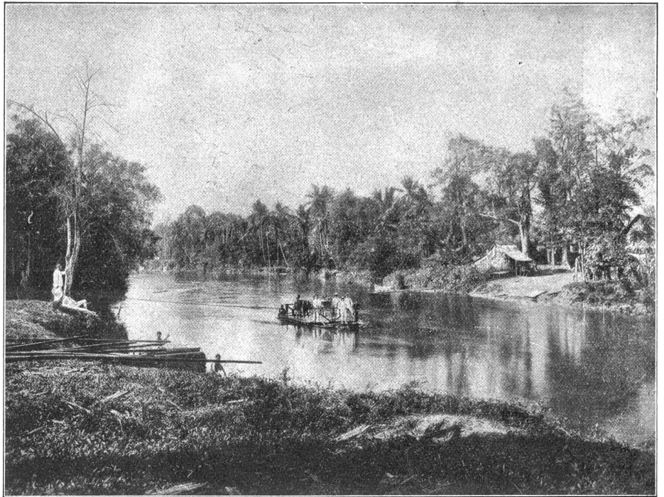
Sähre auf dem Padang.

Alle folgten dem Spiel der Tänzerin erregten Blicks, als sich ein javanischer Jüngling, die Anwesenheit fremder Zuschauer nicht beachtend, auf die Bühne schwang, um den getanzen und gesungenen Liebeswerbungen Antwort zu bringen. Er warf ein paar Kupfermünzen in die bereitstehende Sammelbüchse und machte sich daran, die Bewegungen der Tänzerin nachzuahmen, worin er großes Geschick bewies. Er drehte sich um sie herum, dann folgte er der Fliehenden, zog sich selbst zurück, wenn sie ihm nahte, und so tanzten sie, in jeder Bewegung ein Abbild der Liebe, sich anziehend, dann wieder scherzhafte dem andern ausweichend, um ihn von neuem in heißer Begier zu umwerben