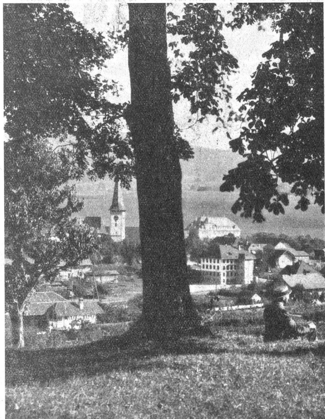
Blick auf das Dorf Köniz.