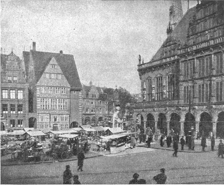
Bremen. — Marktplatz.

sehr das Eigentum ihres Mannes und Gebieters werden, daß ihre Heimat da ist, wo er sich befindet, was die Witwenverbrennung in Vorderindien mit grausamer Tragik bestätigt. (Fortsetzung folgt.)