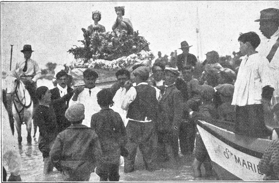
Saintes-Maries-de-la-Mer. Die Reliquien der heiligen Marien werden von den Zigeunern ins Meer hinausgetragen.

weil er gegen unsere Pflanzung vordrang. Da ich als Ingenieur und Offizier eine gewisse Fertigkeit in der Anordnung von Maßnahmen besaß, betraute der Gewaltherr mich damit, und ich war bis spät mit dem Hauen von Schneisen, Anlegen von Gegenfeuern und Niederschlagen der Gluten beschäftigt, gegen die mit Zweigen, Bisangblättern und Hasen gekämpft wurde. Da hieß es nicht nur befehlen, sondern vorbildlich zugreifen und die halbnaakte schreiende Chinesengesellschaft anleiten, wie das Zweckmäßige zu tun war.