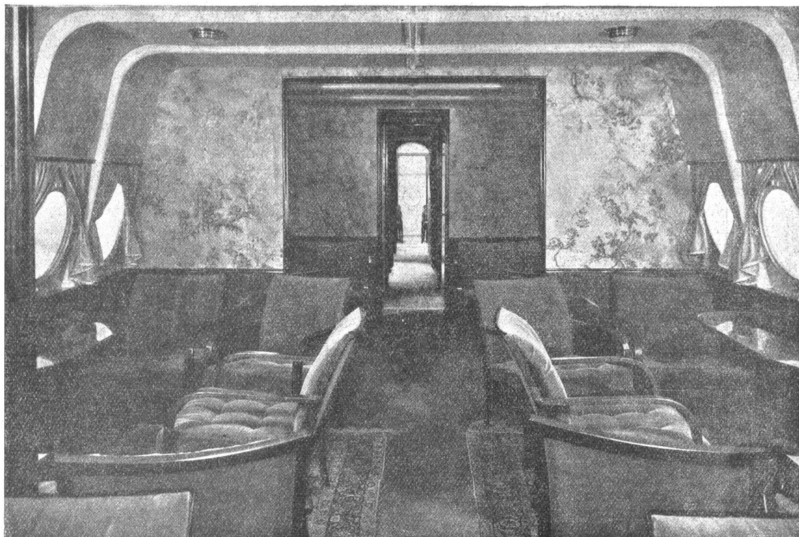
Mittlere Sitzgruppe des Salons mit Durchblick durch den hinteren Passagierraum.

ein mehrtägiger Aufenthalt vorgesehen war, am Montag um 10 Uhr 05 bei günstigen Wetterverhältnissen. Um 10 Uhr 30 überflog es den Zuidersee und nahm dann Kurs auf die Nordsee und England. Ein Reutertelegramm meldete, daß das Flugzeug nach glücklicher Fahrt in England angekommen sei. Als Do. X über Calsoth eintraf, war es von einem Duzend Flugzeugen aller möglichen Systeme umkreist. Der Riesenvogel machte zuerst eine Runde um