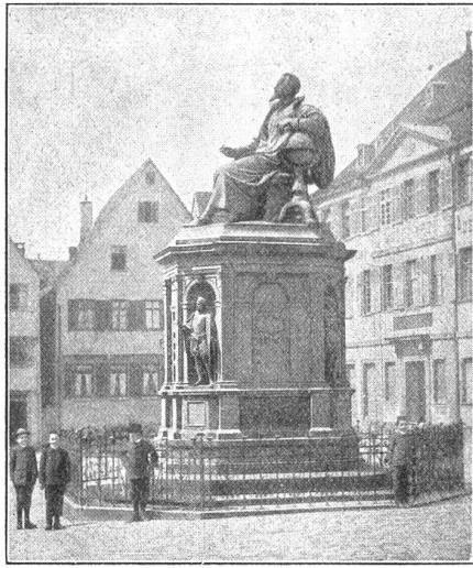
Das Keplerdenkmal in Weil der Stadt (Württemberg). Geburtsort des großen Astronomen.

Zeit gezwungen, ein trauriges Leben unter den drückendsten Nahrungsorgen zu fristen. Denn zwei Hindernisse stellten sich ihm entgegen. Einmal der Umstand, daß die großen Fortschritte der Erkenntnis die Gelehrten und Gewaltigen