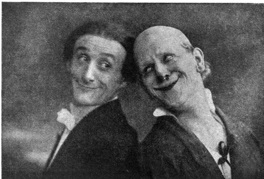
In Petersburg. (Aus „Grock, Ich lebe gern.“)

„Erstes Klingelzeichen! Ich werde mich hinauf zur Bühne begeben müssen, es ist Zeit. Wie oft ich schon auf der Bühne stand? Ich habe es mir neulich ausgerechnet: Ungefähr zehntausendmal. Aber das zehntausendste Mal ist