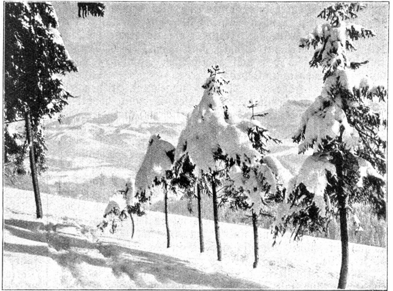
Ausblick vom Ringgis.

Und siehe da, nach einem Stündchen schon brach das leuchtende Sonnenlicht durch das Nebelgewölk, die ganze Landschaft ringsum mit ihren goldenen Strahlen überflutend. Nun, da die Steigung der Straße bereits be-