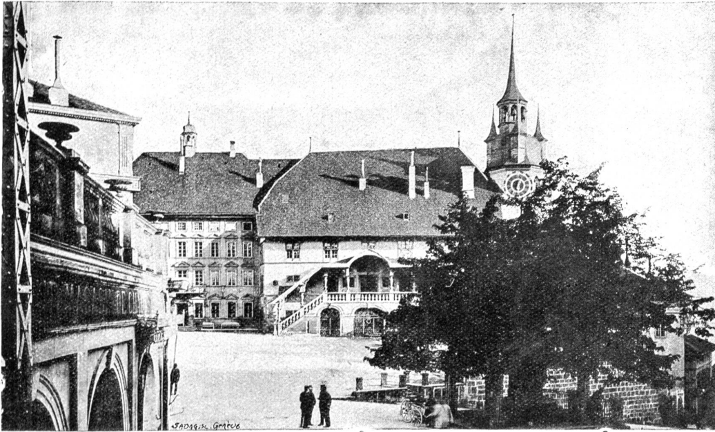
Freiburg. Rathausplatz mit Murtenlinde.

die festgefügteten Betonplatten und das massive Eisengeländer ein unbedingtes Gefühl der Gefahrlosigkeit.