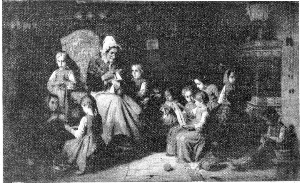
Albert Anker. — Die Nähstube.