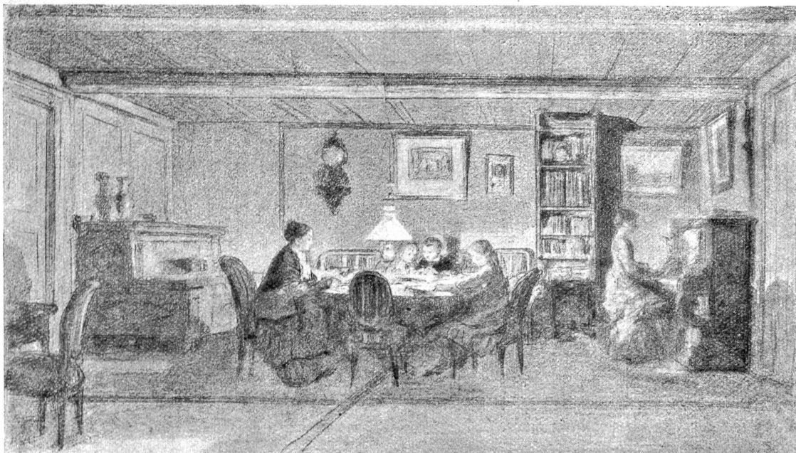
Albert Anker. — Familienlektüre.