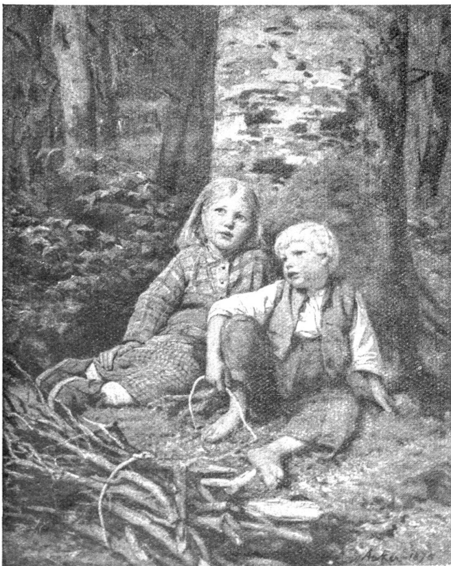
Albert Anker. — Reisigsucher.

Die Hyspa ist nun schon die 4. große Ausstellung auf dem Neufeld-Bierfeld, dem klassischen Ausstellungsgelände Berns. Sie umfaßt mit den auf dem Neufeld (siehe Plan- kizze S. 404) gelegenen Sportplätzen ungefähr das Areal der