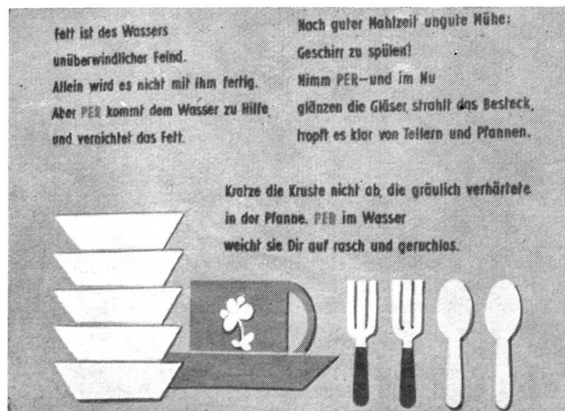
Ein Ausschnitt vom „Persil“-Stand an der Hygiene.