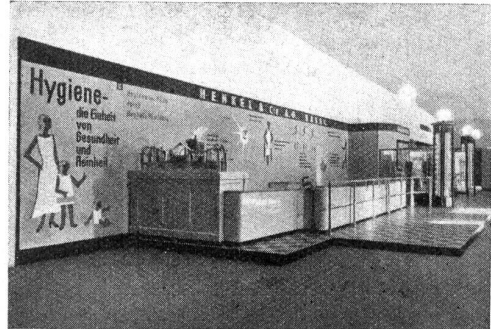
Die Waschtüche für allerfeinste farbige Seidenstoffe.

Waschen schon. Ebenso interessant ist die Maschine, mit deren Hilfe ein endloses Leinenband täglich ca. 25 Mal beschmutzt und immer wieder in heißer Persil-Lauge ausgetoacht wird. Das Band tritt an einer bestimmten Stelle beschmutzt in den Kessel, welcher die Persil-Lauge enthält, bewegt sich verschiedene Male in dieser herauf und herunter und entgleitet ihm darauf, rein und sauber. Es wurde uns gesagt, daß beabsichtigt sei, dieses Band während ca. 20 Tagen, also im ganzen 500 Mal, so auszutoachen, um da-