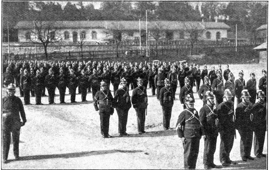
Von der diesjährigen Hauptmusterung der Berner Feuerwehr. Inspektion auf der Schützenmatte.