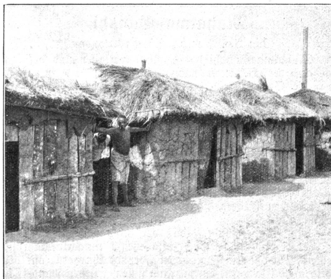
Negerdorf in Marromeu.