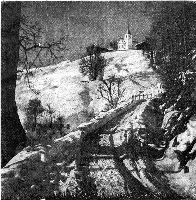
Winter im Prättigau.

Stengeln stand, so schien ihr das eigene Sein. Am besten wäre es, klagte sie, sie hauten mich ab in den wurmigen Wurzeln!