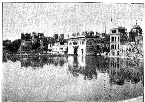
Aus Indien. — Amritsar. Der Eingang zum goldenen Tempel.

Herrscht aber auf einer Seite ein Reichtum, wie wir ihn kaum ausdenken können, so herrscht anderseits in dem Riesenreiche eine Armut, von der wir noch weniger Vorstellungen haben. Elend, Not, Armut wie sie die sonstige Welt nicht kennt, trotzdem die Inder nach dem Zeugnisse Ramsay Macdonalds das fleißigste Volk der Welt sind. Mehr als die Hälfte der Bauern, und das sind über 100 Millionen Menschen, die in 700,000 Dörfern leben, können sich das ganze Jahr an keinem einzigen Tage sattessen, sie leben mitten drin in den reichsten Baumwollplantagen und haben kaum einen Lumpen, um sich zu bekleiden. Von den Wohnungen gar nicht zu sprechen, von denen wir uns überhaupt keine Vorstellung machen können. Ist die Wohnung der Bauern schon eine elende Lehmhütte, die nach jeder Regenzeit zusammenfällt, so sind dies immerhin noch