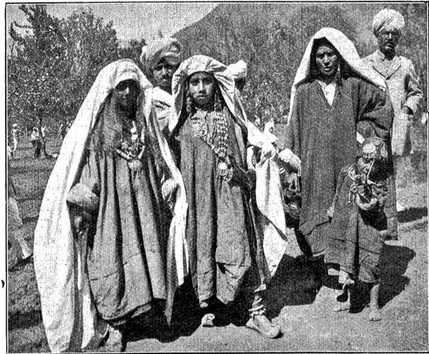
Aus Indien. — Einige Kasmir-Frauen.

ganz anderen Charakter, als sie ihn ursprünglich hatte, und er lenkte sie in ganz neue Bahnen. Der Schluß des Weltkrieges brachte den Indern riesige Enttäuschungen. Sie