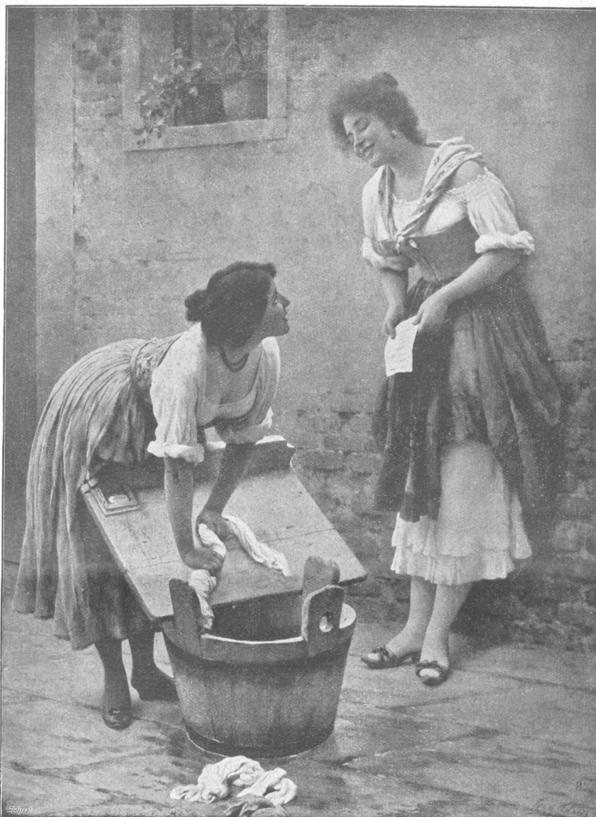
Der Liebesbrief. Nach dem Gemälde von Eugen von Blaas (Venedig).

„Also Michl, guat Nacht! Und nix für unguat weg'n der Sammere! ... Paß auf, no was. Gel? Wenn dir