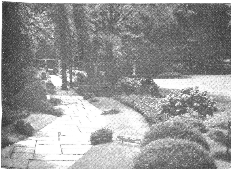
Eingang zum Sondergarten der Firma Walter Pohl, Zürich.

Der Garten bedeutet heute nicht mehr den mehr oder weniger prunkvollen Rahmen um das Haus, der diesem, wie der Rahmen dem Gemälde, Relief geben soll, von der Straße und der Nachbarschaft durch hohes Zaunwerk mit Mauern und Lanzenspitzen abgeschlossen. Der Garten ist nicht mehr Anruf an das Publikum draußen: Seht, so reich und vornehm ist der Besitzer dieser Villa! Nein, der moderne Garten ist die Erweiterung des häuslichen Wohnraumes. Die Alltagsbedürfnisse der Gartenbesitzer, auch die der Kinder und vorab diese, aber auch die der Gäste, die der moderne Mensch nicht mehr formell und förmlich einladet, sondern die er auch ungeladen gerne empfängt, diese praktischen Bedürfnisse gestalten den Garten, den Platz um das Haus. So wie heute das Wohnhaus nicht mehr von außen nach innen, um seiner Fassade willen, sondern aus dem Innern heraus, mit dem Wohnbedürfnis als Ausgangspunkt und Richtungspunkt, gebaut wird, so verlangt man heute von einem Garten, daß er in erster Linie den Wohnbedürfnissen der Hausbewohner, der Familie und nicht dem Repräsentationsbedürfnis des Hausbesitzers diene.