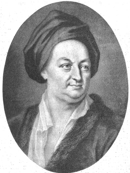
Albrecht von Haller (1708—1777), der grosse Dichter und Gelehrte. Mitglied des Grossen Rates und Rathausamman, von 1758—1764 Salzdirektor in Roche.

Bierlig festgesetzt mit örtlichen Zuschlägen zufolge Transportkosten. Es entstanden nun feste Verkaufsstellen (Salzbütten)