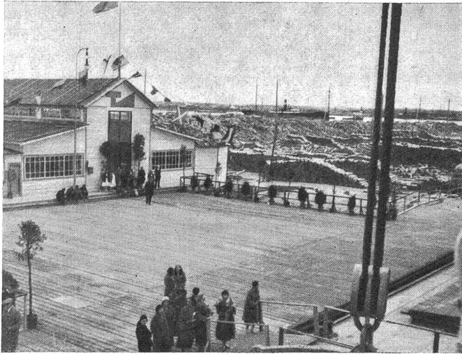
Die „Oceana“ ankert im Holzhafen von Leningrad. Links ein „Torgsin“-Laden, das ist ein staatlicher Verkaufsladen für Fremde. Im Vordergrund die staatlich angestellten Führerinnen.

O, sie wußte es gar wohl: weil seine Liebe zu ihr eben selbst schon das treueste Versprechen, seine Leiden-