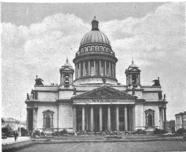
Die Isaaskathedrale in Leningrad, heute ein Antireligionsmuseum.

Wir stehen auf dem Worowskij-Platz. Worowskij ist in der Schweiz kein Unbekannter! Ihm zu Ehren ist dieser