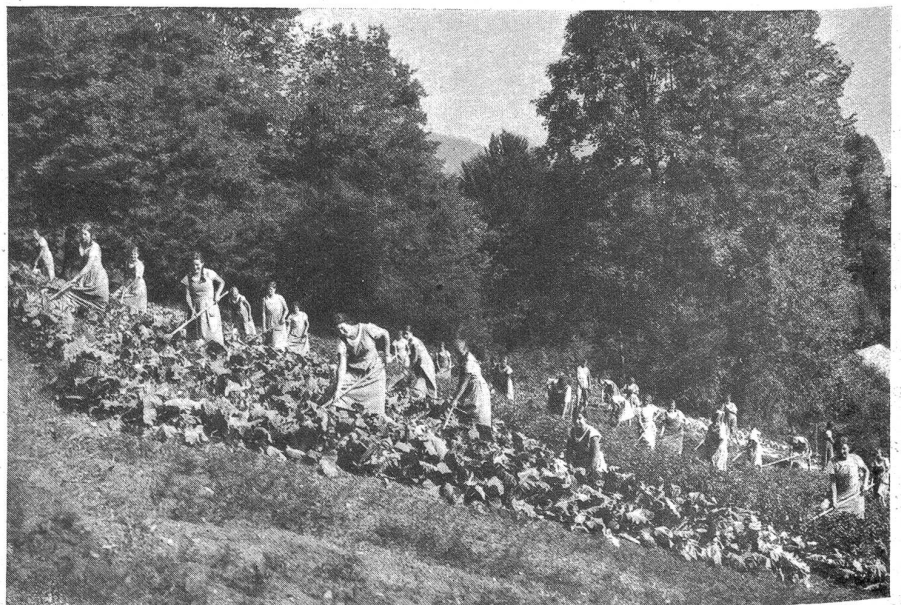
Die Gartenbauschülerinnen bei der Arbeit.

berichtes: „Unsere Schule bildet lebensstarke Menschen, daß ihnen die Arbeit zur Freude und zum täglichen Bedürfnis wird.“ Die sonnengebräunten Kurstöchter sehen in ihrer einheitlichen Arbeitskleidung gar nicht weltfremdlich oder heimwehkrank aus; es wird geturnt und gesungen, werden Ausflüge gemacht auf Bergeshöhen und in lehrreiche gärtnerische und andere Anlagen. Ihre praktische Arbeit liegt in den wohlgehaltenen Pflanzungen vor aller Augen; die theoretische Ausbildung aber wird durch staatlich kontrollierte Prüfungen überwacht. Fünf Lehrkräfte sind beflissen, das Wissen und Verstehen der Kurstöchter zu bilden und einlichtiger Praxis eine gediegene Grundlage zu geben. Kenntnisse zu erarbeiten ist das Eine, sie anzuwenden der Endzweck arbeitsvoller Lehrjahre. Nicht bloße Fachkunde ist das Ziel der Anstalt, sondern Erziehung. Der Kurse sind mehrere, je nach den Bedürfnissen der Schülerinnen; sie steigen von einem instruktiven Ferienaufenthalt von ein oder zwei Monaten bis zu dreijähriger voller beruflicher Ausbildung zur Berufsgärtnerin. Es ist daraus zu ersehen, daß die Gartenbauschule sich nicht ausschließlich mit solchen befaßt, die in