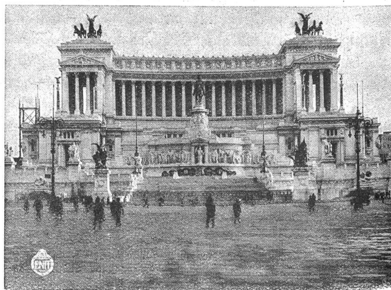
Rom. Monumento nazionale.

Die italienische Landesgruppe der Internationalen Gesellschaft für kaufmännisches Bildungswesen veranstaltete im verfloßnen Sommer einen Wirtschaftskurs in Form eines Wanderkurses, der die Teilnehmer mit den wirtschaftlichen Verhältnissen Italiens und mit dessen Land und Leuten im allgemeinen bekannt machte. Es fanden zu diesem Zweck zahlreiche Exkursionen und Besichtigungen statt. Vorträge