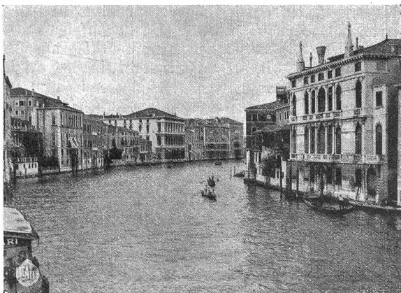
Venedig. Canal Grande.

gressist ein feines Krämlein als Andenken nach Hause gebracht. Ob wohl jeder Käufer das Erworbene an der Grenze auch verzollt hat? Der Samstagvormittag endlich war bestimmt für die Besichtigung der modernen Hafen- und Fabrikanlagen von Marghera. Ein neues, zukunftsreiches Venedig ist hier neben dem alten aus seiner glorreichen Vergangenheit entstanden und liefert einen eindeutigen Beweis dafür, daß Italien unter seinem willensstarken Duce zu neuer Zeit erwacht ist. Daß die Kongressisten in freien Stunden einzeln und gruppenweise die Markuskirche, den Dogenpalast, die Kunstakademie und weitere Sehenswürdigkeiten der kunstreichen Stadt besuchten haben, braucht wohl kaum erwähnt zu werden. Manch einer hat auch nicht unterlassen, am frühen Morgen den zutrau-