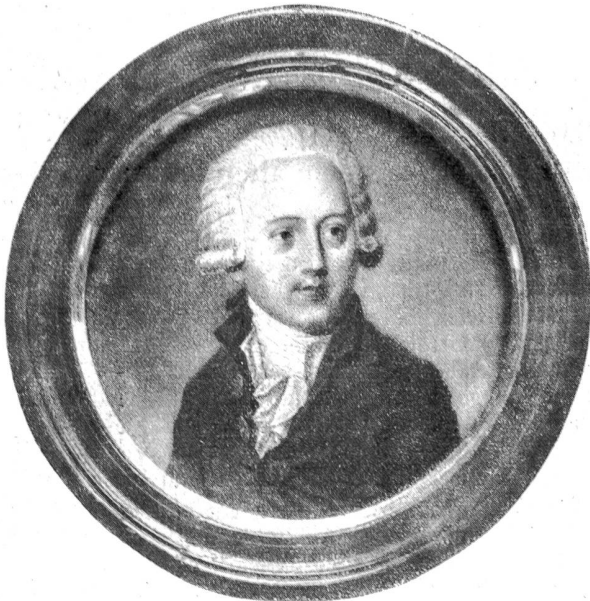
Henry Louis Jaquet-Droz, 1752—1791.