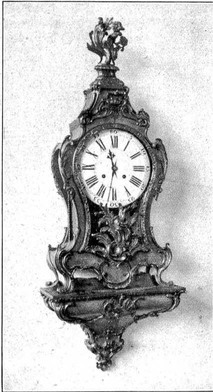
Pendule Louis XV. von David Robert.

Bevor ich gehe, bewundere ich noch das Bild jener Louis XV.-Pendule, die Zeuge war der rauschenden Feste im Ambassadorenpalais zu Solothurn. Dieses Meisterwerk,