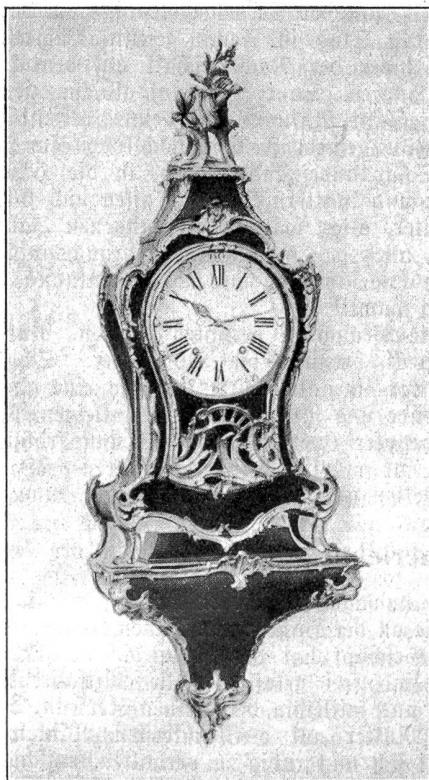
Pendule Louis XV. von Pierre Jaquet-Droz.

reizend ins Gesichtchen steht — eine ältere Frau im Bonnet Neuchâtelois — ein Mann mit Puderperücke — und mitten in all den alten Kleidern, Hüten, Uniformen, in den jungen