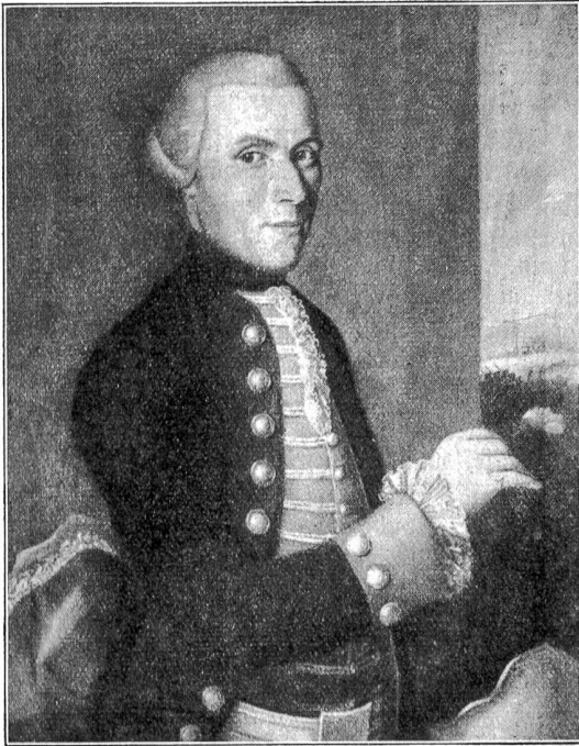
Capitaine David Robert. 1717—1769.

Sizilien) war, einen Saal des Schlosses Wartegg am Bodensee, das inmitten eines mit hohen, alten Bäumen bestandenen Parkes weit über den See und das fruchtbare Land in die blaue Ferne schaut.