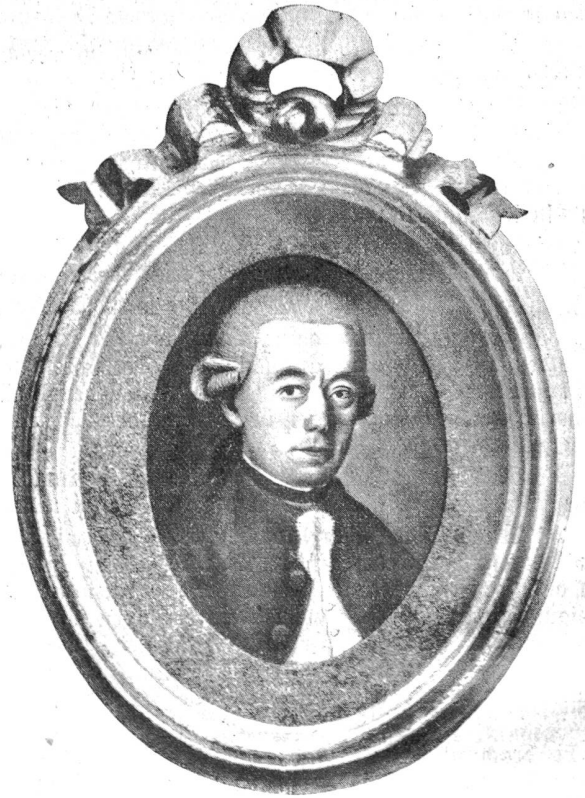
Pierre Jaquet-Droz, 1721—1790.

Die alteingesessenen Bernergeschlechter haben je und je ein Faible für die Neuenburgerpendulen gehabt, und wir fänden wohl in fast jedem Patrizierhaus eine Vertreterin der „belle Neuchâteloise“. Die prächtigen Werke der Uhrmacherkunst im Stile Ludwigs XIV., XV. und XVI. mögen die Erinnerung an jene Zeit wachrufen, da die Vorfahren im Dienste der französischen Könige standen und dort den Ruhm schweizerischer Tapferkeit und Treue festigten. Oder weiß jene Pendule, auf deren sattbraunem Grundton die Bronzeverzierungen plastisch sich abheben, von dem Tage zu erzählen, da General Bonaparte unserer Stadt einen kurzen Besuch abstattete? Im November 1797 sollte der „petit caporal“ schon in Coppet von acht Abgeordneten Berns empfangen werden. Aber Napoleon passierte den Ort ventre à terre, die Berner jagten der Kutsche nach und holten sie in Nyon ein. Rolle, das prächtig illuminiert und farbige Transparente aufgestellt hatte, wurde passiert, und bald begrüßten in Lausanne drei Ehrenjungfrauen — eine in Blau, eine in Weiß und die Dritte in Rot — den „kommenden Mann“. In Domdieu stieg Bonaparte in einer