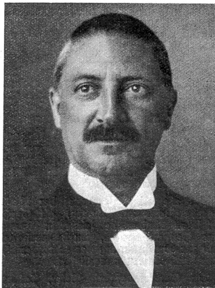
Dr. Johannes Baumann, Herisau, der neugewählte Bundesrat.

Der Bundesrat delegierte an den 16. internationalen Landwirtschaftskongreß in Budapest Minister Jäger, Gesandter der Eidgenossenschaft in Wien. — Er beauftragte die Schweizerische diplomatische Vertretung in Tokio, an der in Tokio stattfindenden internationalen Konferenz des Roten Kreuzes das Schweizerische Rote Kreuz zu vertreten. — Er sicherte für die Zuderrübenenernte 1934 einen Preis von Fr. 3.20 für 100 Kilo im Inlande angebaute Zuderrüben. — Für das eidgenössische Schützenfest 1934 in Freiburg beschloß er die Ausrichtung einer Ehrengabe im Betrage von Fr. 10,000. — Er faßte den Beschluß zur Ausweisung des rumänischen Staatsangehörigen Alfred Hefter aus dem Gebiete der ganzen Schweiz. Der Zeitpunkt, an welchem Genannter die Schweiz zu verlassen hat, wird später festgesetzt. — Die Zolleinnahmen der Schweiz im 4. Quartal 1933 beliefen sich auf Fr. 74,769,986, um Fr. 13,189,193 weniger als im letzten Quartal des Vorjahres. Im ganzen Jahre 1933 sind 274,770,574 Franken an Zöllen eingegangen, um Fr. 15,261,320 weniger als im Vorjahre.