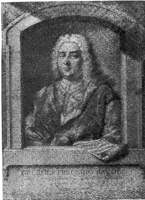
Georg Friedrich Händel.

Hatten die Gegner des „Sachsen“ bisher nur geheime Wühlarbeit gegen ihn verrichtet, nun, angesichts seiner überhandnehmenden Erfolge, traten sie aus allen Lagern offen auf