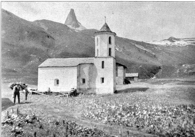
Zerfreila im Vals, 1780 Meter über Meer. Kirche mit Zerfreiler Horn.

Scheuten heutige Männer und Frauen die Arbeit in den höchsten Tälern nicht, würde der Staat diese Besiedlung tatkräftig fördern, wir glauben, aus alten Walsersiedlungen könnte noch einmal neues Leben erwachsen. Die Besiedlung der höchsten Alpentäler im Laufe der Jahr-