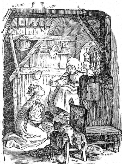
Ludwig Richter: Dornröschen.

Besinnen, „denn ich habe im Gegenteil eine vernünftige Frage von Ihnen erwartet. Und nun müssen Sie aber auch