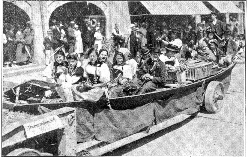
Bärnfest 1934. Das Thuner Märtschiff.