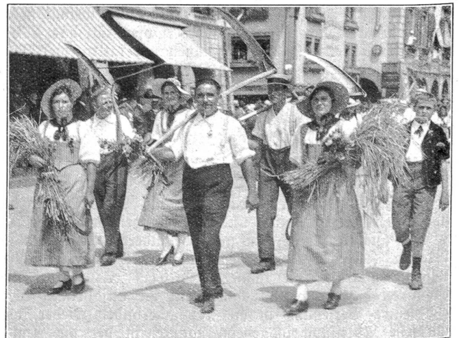
Bärnfest 1934. Gruppe Wohlener bei Bern.

Und wiederum wie selbstverständlich ist es, daß der Städter aufs Land hinaus geht auf Besuch zur befreundeten Familie, zu Vater und Mutter, zu Schwager und Schwägerin, zu Onkel und Tante, und daß er sich im Dorf, im Dörfchen, im Bauernhaus und Arbeiterhaus daheim fühlt. Da ist kein gesellschaftlicher Gegensatz, auf Bildungs- oder Vermögensunterschieden beruhend. Eine er-