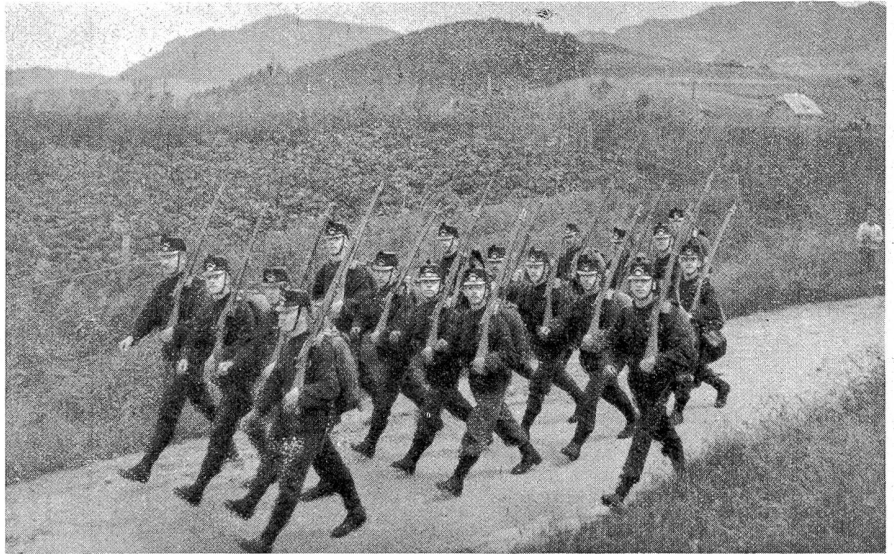
Junges Kader. (Aus der Unteroffiziersschule 1912.)

Frühzeitig genug war alles auf den bezeichneten Bataillonsplätzen beisammen, hatte einander die Hand geschüttelt, „Grüß Gott“ gesagt und Strategie entwickelt. Punkt 9 Uhr erscholl über den ganzen Platz der Befehl zur „Sammlung“. Es ging in den Krieg, natürlich, und jeder suchte sich daher in die Abteilung desjenigen Zugführers zu „drück-