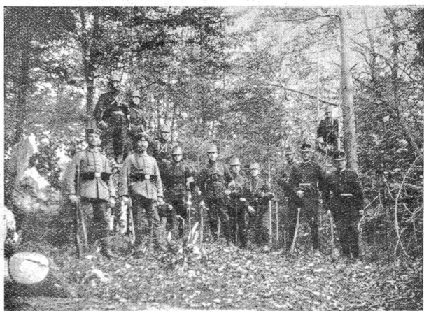
Im Wald bei Ottendorf.

„Sensationell“ wirkte der Urlaub eines Stadtberners, dem die Mutter gestorben war und der für diesen Ausnahmefall für zwei Tage heim durfte. Man umringte ihn nach seiner Rückkehr, um zu hören, wie es in der Bundesstadt aussehe, was die Menschen trieben, wie die Geschäfte gingen usw. Trotzdem man ja durch die Feldpost mit seinen Angehörigen und Bekannten in Verbindung blieb, war man eben doch auf jede Neuigkeit, besonders noch durch einen Augenzeugen, gespannt. Viel bespöttelt wurde ein weiterer