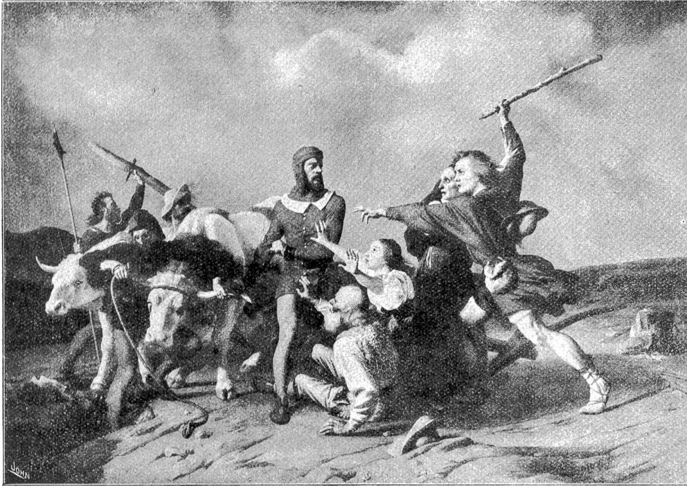
Jean Léonard Lugardon. Arnold von Melchtal.

Und mit dem Essenkochen auch. Es war wirklich eine Knausererei von Rife, daß sie ihr nur das Mittagessen ins Haus schickte. Abendbrot und Frühstück und Kaffee konnte sie auch verlangen. Bloß den Nachmittagskaffee! Oh, sie war nicht unverschämt. Den Morgenkaffee wollte sie sich gerne auf ihrem Gasherd — Gas in der Küche mußte sein! — auch künftig selber kochen. Schon damit sie morgens so lange im Bett liegen bleiben konnte, wie sie wollte. Das würde ihr bald über werden? Ihr? Neel! Gab's was Schöneres für eine schwache alte Frau, die sich siebzig Jahre lang von früh bis spät abgeradert hatte, als wenn sie des Morgens im Bett sagen konnte: „Id bruuk noch nich upto stan!“ Zwanzigmal, fünfzigmal, hundertmal, so oft es ihr Spaß machte. Leise, halblaut, kräftig, daß man's durch die Wände hörte: „Stiel Mischeessen uut dei Braden bruukt noch nich upto stan!“ (Fortsetzung folgt.)