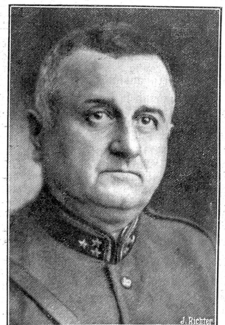
Oberst Eugen Bircher (Aarau) ist zum Oberstdivisionär ernannt worden.