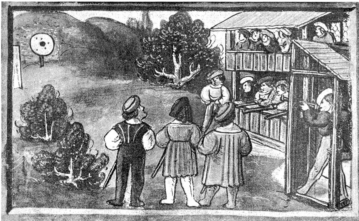
Die Zielstatt der Schützen um 1500 (aus der Chronik von Diebold Schilling.)