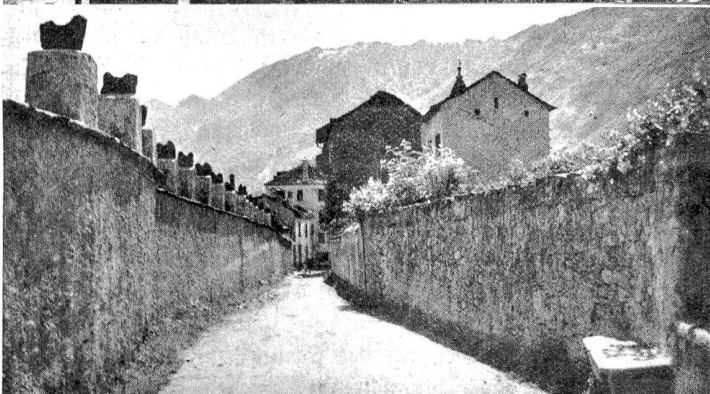
Oben: Blick auf Ascona und das Maggiatal. Mitte: Ascona und der Osthang des Monte Verità. Unten: Wegmauer in Ascona und ihre gute Wirkung.