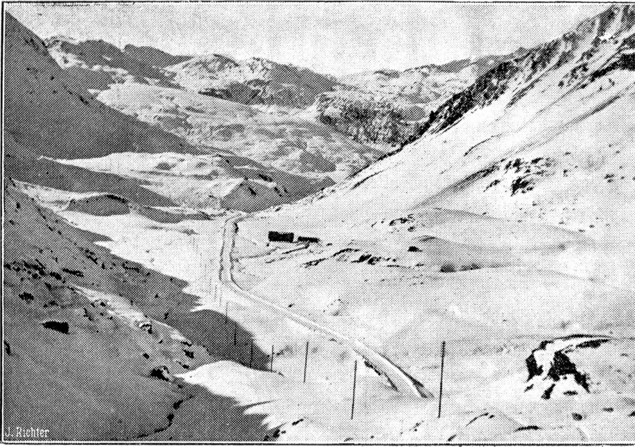
Die höchste passierbare Autostrasse der Welt im Winter.

Erstmals im Winter per Auto über die Alpen. Die 2400 Meter über Meer gelegene Paßstrasse über den Julier wird diesen Winter erstmals für den Verkehr nach dem Engadin und weiter nach Italien offen gehalten. Die Paßstrasse wird bei Neuschnee täglich mit einer Schneeschleudermaschine fahrbar gemacht. Dieselbe ist auf Julier-Hospiz stationiert, wo übrigens ein stattlicher Stab von Arbeitern Tag und Nacht für Schneeräumungsarbeiten zur Verfügung stehen. Der Julierpass ist somit die höchst gelegene im Winter passierbare Autostrasse der Welt. Das Schneeräumungspersonal hat oft mit meterhohen Neuschneemassen zu kämpfen. Unser Bild zeigt eine wundervolle Rundschau über die tief verschneiten Bündneralpen, die in hellen Tagen ein unvergleichlicher Anblick bieten. In der Tiefe erkennt man die gebahnte Paßstrasse.