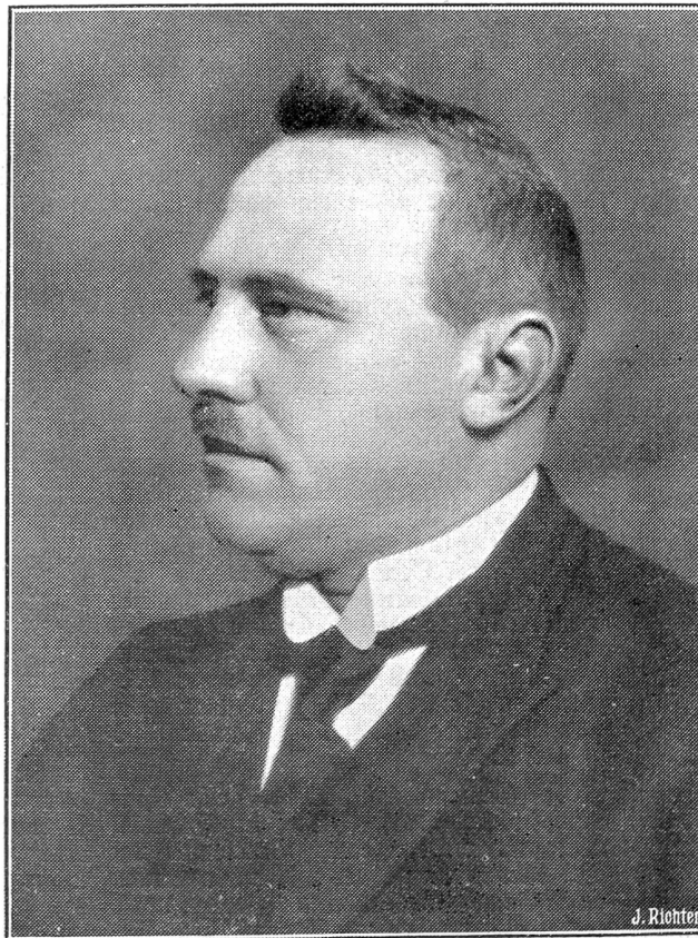
Rudolf Minger, Bundespräsident pro 1935.