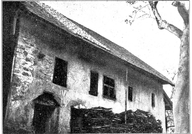
Südfassade der einstigen Kirche von Kleinhöchstetten.