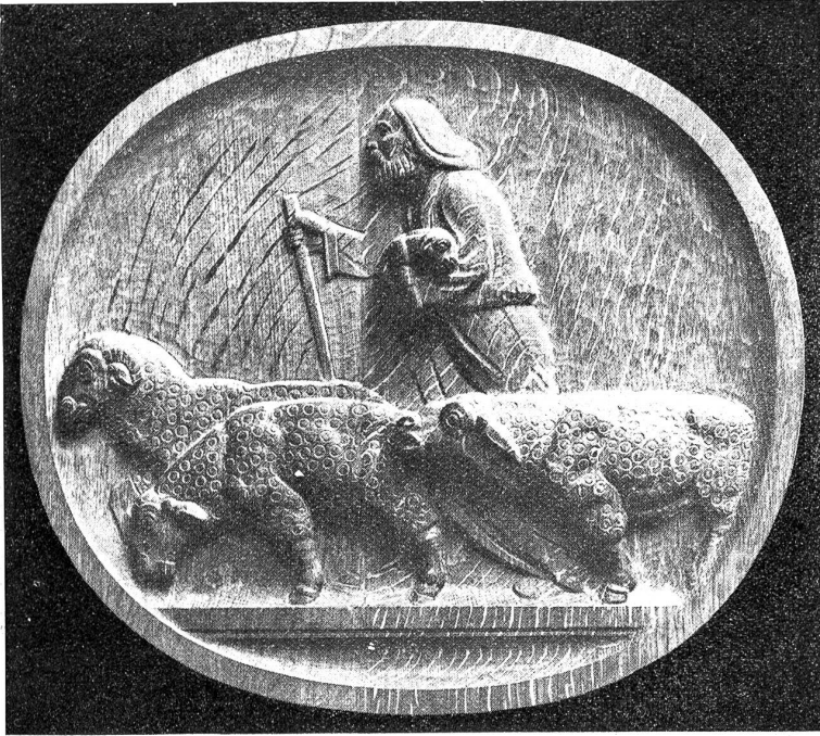
Der gute Hirte (Kanzeldekoration).