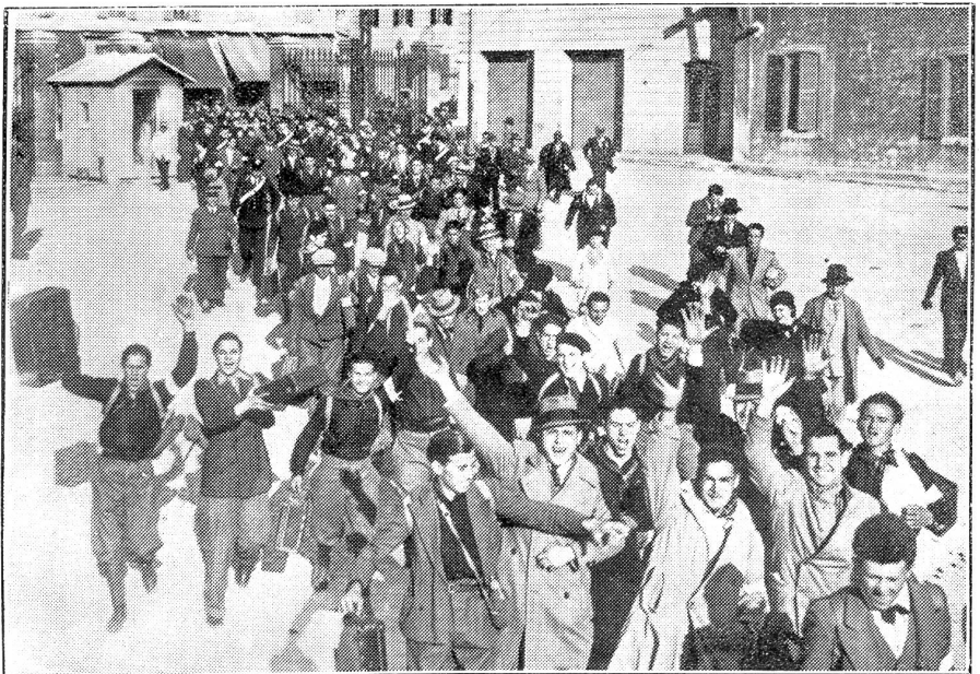
Italien ruft die Klasse 1914 unter die Fahnen.

Der französische Standpunkt scheint auch in der Beurteilung Deutschlands zu gipfeln, aber es will, daß die drei Mächte eine solche durch den Völkerbund aussprechen lassen. Die in Genf ausgesprochene Verdammung, so denkt Paris, habe mehr Gewicht als ein nur von Mussolini und Frankreich gefälltes Urteil.