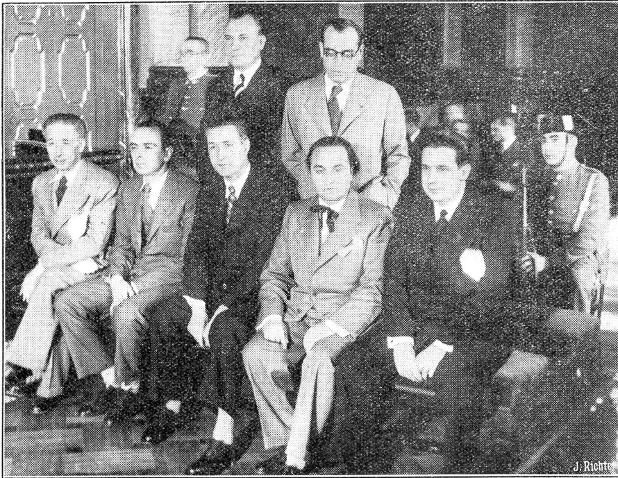
Die Führer der separatistischen Rebellion Cataloniens auf der Anklagebank.

In Madrid begann dieser Tage vor dem Obersten Gerichtshof der Prozess gegen die catalonischen Separatistenführer, die im Oktober 1934 die Unabhängigkeit Cataloniens erklärt hatten. Bekanntlich wurde dieser Aufstand von den spanischen Truppen niedergeschlagen. Unser Bild zeigt den Haupttrüffelsführer, den Expräsidenten von Catalonien M. Companys (links), neben ihm seine Mitverschworenen.