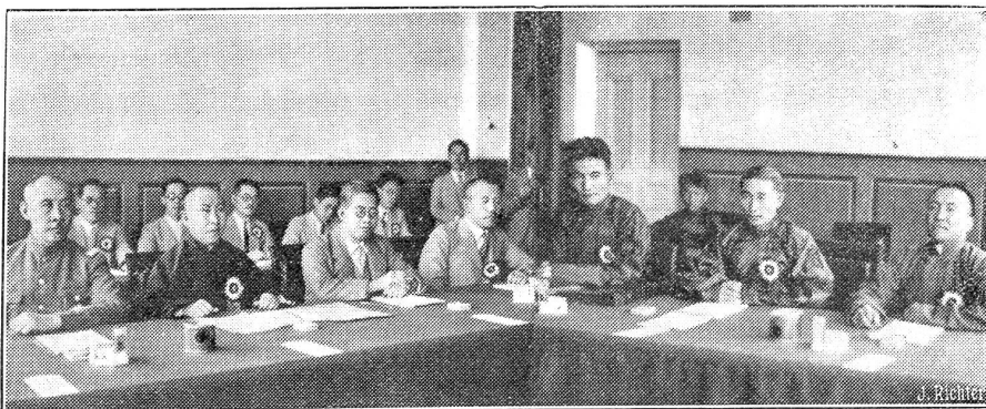
Die Mandschuli-Konferenz tagt.

Lord Siegelbewahrer Eden hat Laval in Paris besucht und ... habe ihn völlig über das deutsch-britische Flottenabkommen beruhigt. So meldet ein Communiqué. Was hat Eden Laval gesagt? Wirklich nur das Eine, daß England nach wie vor an den Abmachungen vom Februar festhalte und weiterhin in der gleichen Front mit Frankreich stehen wolle? Die grundsätzliche Bedeutung des Flottenabkommens besteht darin, daß die Deutschen ihre Flotte nie über 35 Prozent der gesamtbritischen steigern dürfen. Dem deutschen Wettrüsten ist damit ein Kiegel geschoben. Das von England hiemit zum erstenmal gegebene Beispiel soll aber Schule machen. So ist es der Wille Englands. Die Deutschen sollen noch eine Reihe von Konzessionen erhalten, mit jeder Konzession aber einen weitem feierlichen Verzicht leisten.