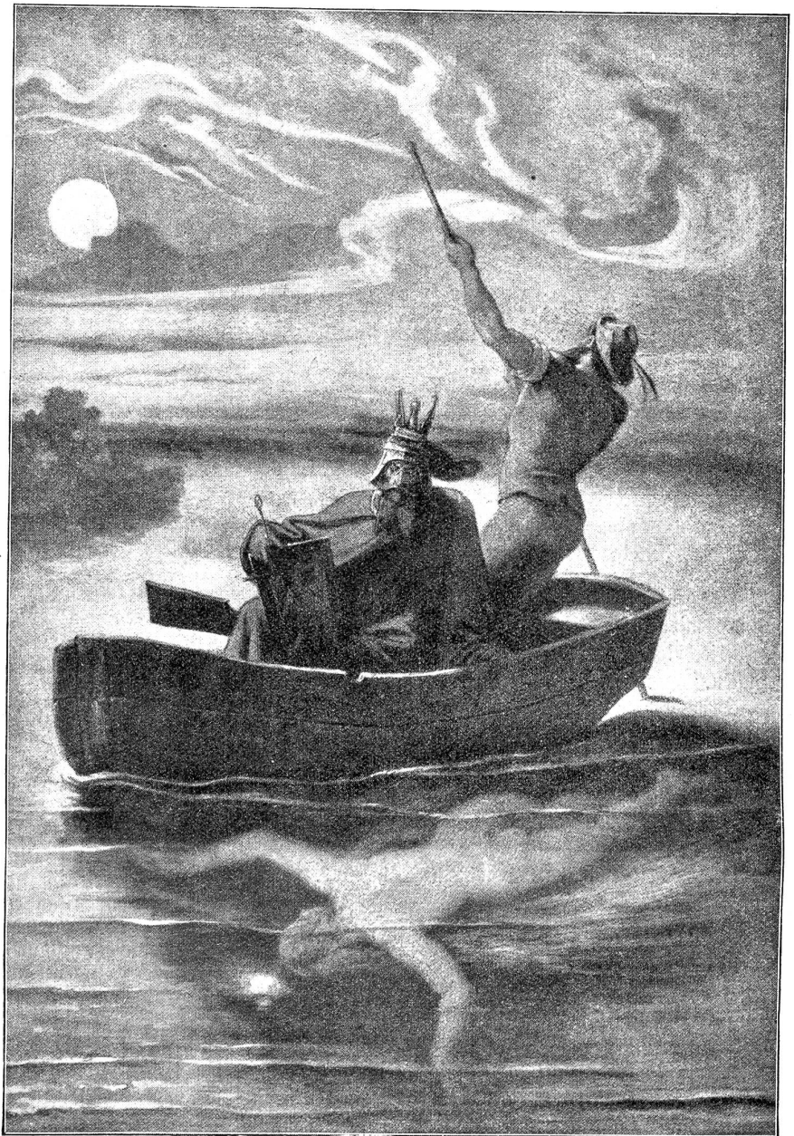
M. v. Schwind: König und Nixe.

Es ist wohl nicht zu verwundern, daß der Heier dann