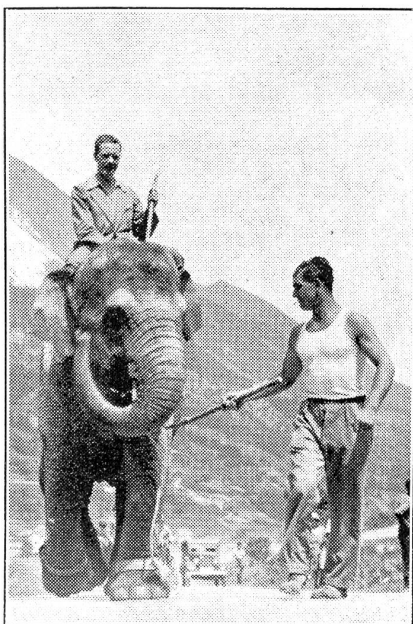
Richard Halliburton auf dem Elefanten unterwegs nach dem Grossen St. Bernhard.

größten Teil durch Versicherung gedeckt ist, wird auf mehrere hunderttausend Franken geschätzt.