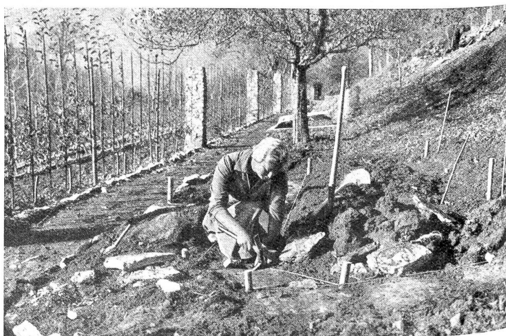
Werktätige Uebung beim Legen von Plattenwegen. Der neue Gewürzgarten wird angelegt.

Es ging aber auch etwas Mütterliches, Starkes von dieser Frau aus, die gleichsam die Seele auf der Alp und die vorbildlichste unter allen Arbeitskräften war. Nie sah man sie untätig und auch nie mißmutig, obschon ihr das