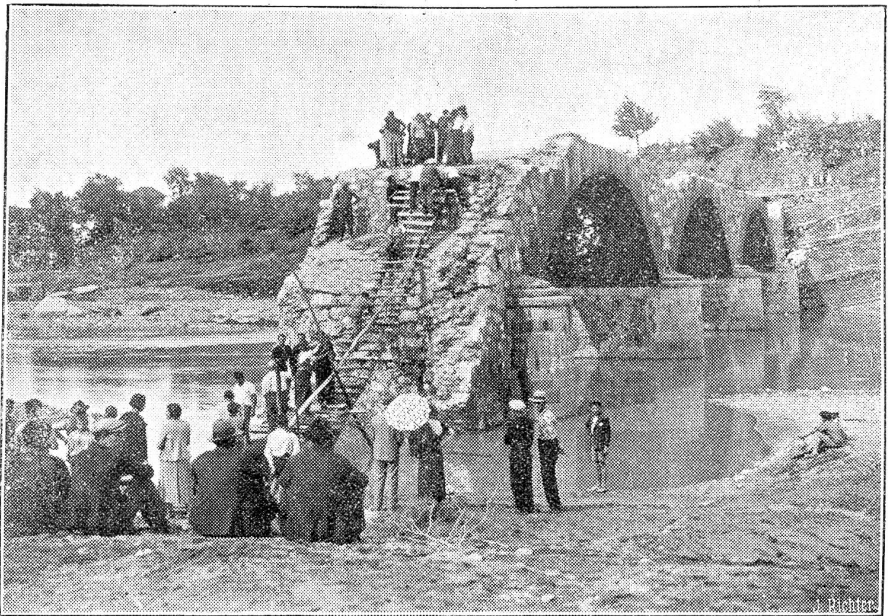
Der Dambruch bei Ovada (Italien). Unser Bild zeigt eine der vier eingestürzten Brücken.

Ein wunderbare isch mer gsi wie dr Pilot i mene fettige Näbel si Wäg gfunde het. U d'Frag het mi bsunders beschäftigt wägem Lande. Mi cha ja ganz sicher mit eme Kompaß stüre. I ha mer la erzelle, wi me uf drahtlosem Wäg chönn em Pilot Zeiche gä, daß dä geng ganz genau wüß, wo ner sig, was er mache müeß. Er sig geng mit ere Bodestation i Verbindig und drum chönn er so sicher da obe i de Lüfte si Wäg suche. Mir hei üse Wäg a Bode abe nid müeße im Näbel sueche. Es het wieder ufta, wo mer gäge d'Schwiz cho si. I weiß nid wie mers gange isch. I ha so viel gseh, daß i ganz erstunt gfragt ha, was isch das für e große Strom da unde? Mi het mer gantwortet: Se, dr Rhj. Tä und de die große Stadt mit dene Brügge u Chilchsturm, isch das scho Basel? Wahrhaftig, es isch halbi sächsi gsi u mir sie wieder i nere elegante Schleife uf e Bode cho. Kei Minute zfrüh u keini zspät. I bi ganz überrascht gsi über die Pünktlichkeit.