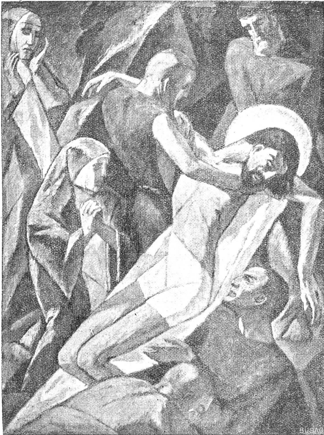
E. Linck: Die Grablegung Christi.