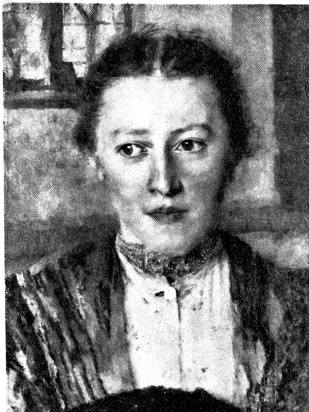
Wilhelm Leibl: Bauernmädchen mit Halskette. (Ausstellungskatalog.)

„Dieser Schlendrian in der Schule“, fuhr der Direktor lebhaft fort, „hat lange genug gedauert. Dieser filzige Schultubenfram hat sich den Leuten des Dorfes und der Gemeinde mitgeteilt. Ob hablich oder arm, ob Bauer oder Knecht, ob Arbeiter oder Gewerbler, ob Dorfagnat oder williges Stimmfutter, alles gondelt in plump überlieferten