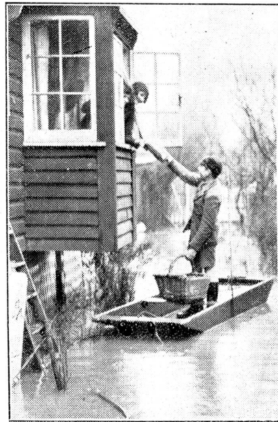
Erneute Ueberschwemmungen in England. Bäckerjunge im Kahn.

verhandelt wurde? Das Ausschalten Italiens durch den Krieg, sein abnehmender Einfluß an der Donau, seine militärische Bedeutungslosigkeit für den Fall einer Verwicklung seien, so heißt es, die Gesprächsthemen gewesen. Auf gut