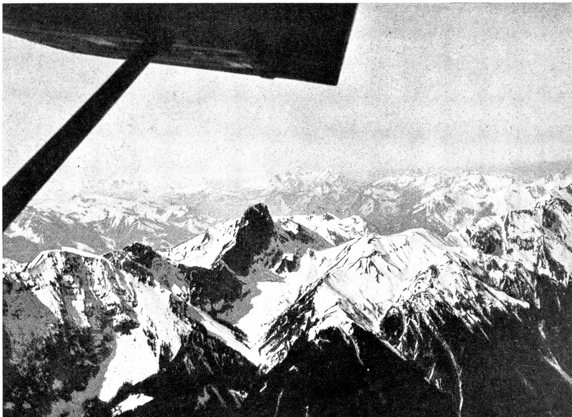
Stockhorn mit Freiburgerbergen. (Zum Aufsatz „Ein Oberlandflug im Winter“, S. 205.)

Als er das gußeiserne Tor hinter sich schloß, hörte er Franzens harte Stimme nach den Hunden rufen. Was hatte der gefährliche Mensch vor? Lothar fühlte, daß ihn von diesem Hause Welten trennten, die auch durch Liebe nicht zu überbrücken waren. (Fortsetzung folgt.)