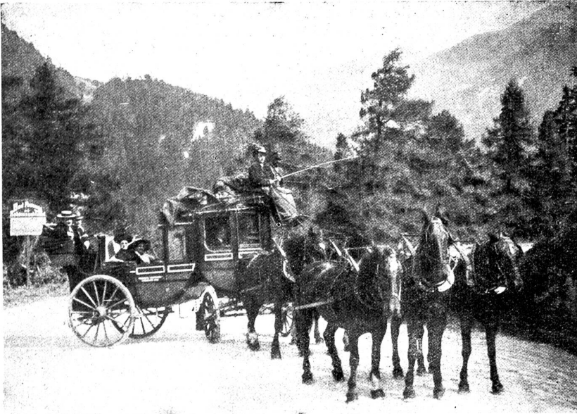
Eine 5spännige Alpenpost (8plätziger Kupee-Landauer.)

irgendwelchen anderen Regeln sein sollte, sondern ein erbitterter Faustkampf, fortgeführt, bis der eine oder andere niedergeschlagen war. Aus diesem Grunde war auch ein Umpire nicht vomnöten.